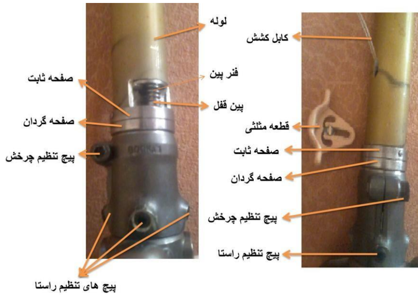
شکل-۲. جزئیات عملکرد قطعه چرخاننده مچ پای پروتزی

میانگین ۴۶/۱ ماه از زمان استفاده از پروتز کنونی شان می‌گذشت (جدول-۱).