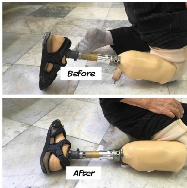
شکل-۳. عملکرد قطعه چرخاننده مچ پای پروتزی در وضعیت دو زانو در فرد قطع عضو