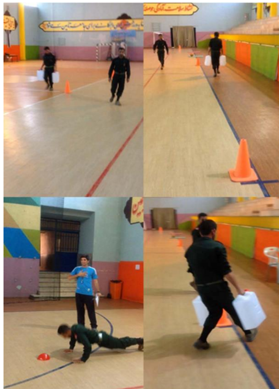
شکل-۲. اجرای تست MOB