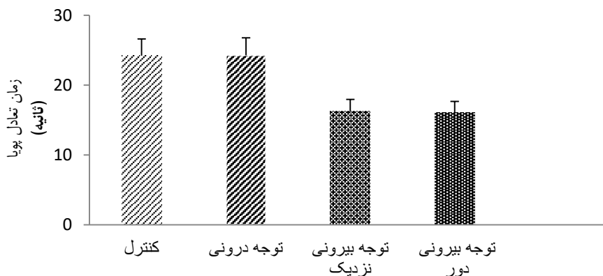
شکل-۲. نمودار زمان تعادل پویا در شرایط توجهی مختلف