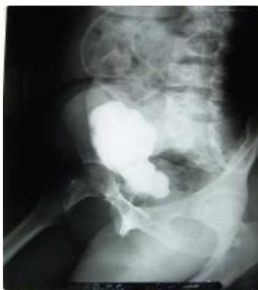
شکل 4 - سیستوگرافی 4 هفته بعد از ترمیم فیستول با سگمان ایلئوم افزایش حجم مثانه را در خانم 29 ساله نشان می‌دهد.

هیچ بیماری پس از عمل دچار بی اختیاری ادراری نبود. چهار بیمار بطور طبیعی از مجرا ادرار می‌کردند و باقیمانده ادراری قابل ملاحظه نداشتند. ولی در سه بیمار دیگر که از طریق مجرا ادرار می‌کردند به علت باقیمانده ادراری قابل ملاحظه نیاز به سونداژ متناوب تمیز 5 (CIC) 2 تا 3 بار در روز داشتند و یک بیمار هم از طریق کاندوئیت آپاندیس که در ناف بیمار قرار داشت هر 6 ساعت سونداژ می‌نمود. عوارض متابولیک و عفونت مجاری ادراری در بیماران دیده نشد. هیدرونفروز و انسداد حالبی در بیماری که تحت پیوند حالبی قرار گرفته بود بر طرف گردید. در بیماری که کاندوئیت آپاندیس داشت چندین سنگ در مثانه جدید ایجاد گردید. همه بیماران از فعالیت جنسی طبیعی رضایت داشتند.