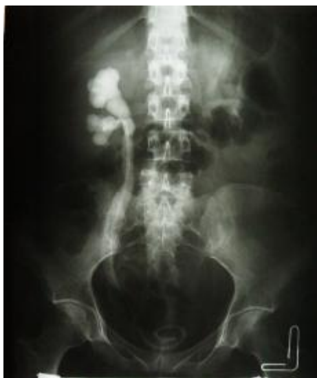
شکل 1 - پیلوگرافی وریدی در یک خانم 47 ساله بعد از گذاشتن سوند DJ

چندین بار عمل ترمیمی ناموفق بودند. بیماران قبل از عمل تحت معاینه فیزیکی، سیستوگرافی جهت ارزیابی مسیر مجرا و سیستوسکوپی و بیوپسی از محل فیستول جهت اطمینان از عدم عود تومور و اوروگرافی وریدی (IVP) قرار گرفتند (شکل 1). در یک بیمار فیستول بین دو سوراخ حالبی و در بقیه موارد در دیواره های جانبی یا بالاتر از تریگون قرار داشتند. بیوپسی از محل فیستول جهت بررسی و وجود نئوپلاسم منفی بود.