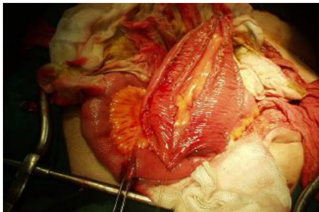
شکل 2 - قطعه ای بطول 15 تا 20 سانتیمتر از ایلئوم را با حفظ عروق آن از روده جدا نموده که پس از برش از ناحیه آنتی مزانتریک آنرا به شکل U تغییر شکل میدهند.

قسمت خلفی در محل فیستول وزیکوواژینال باز شد. سپس سوراخهای حالبی توسط سوندهای حالبی، کاتتریزه شد. برش جهت جدا کردن دیواره قدامی واژن از دیواره خلفی مثانه تا پشت محل فیستول صورت گرفت بطوریکه فضای مناسب جهت گذاشتن امتنوم بعنوان Interposition graft ایجاد شد. مجرای فیستول جدا و همه بافت های فیبروتیک اطراف آن خارج و جهت بررسی