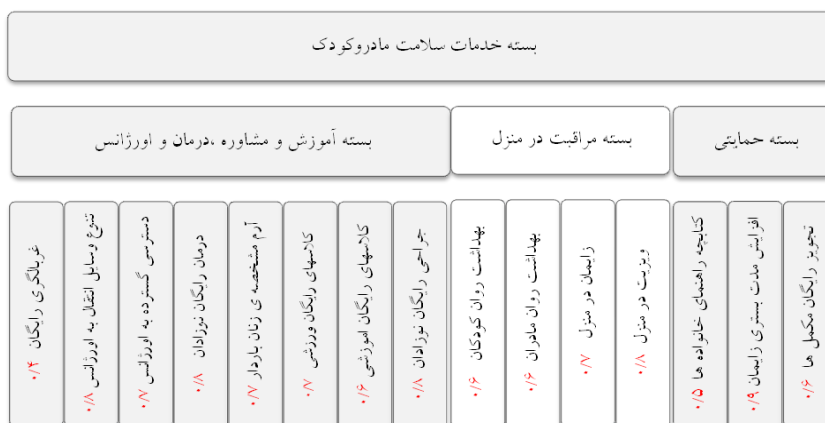
شکل ۲- مدل بسته خدمات سلامت مادر و کودک با توجه به یافته‌های مطالعه تطبیقی و بار عاملی آن‌ها

بارداری و حمایت روحی مادران در طی زایمان باعث کاهش اضطراب مادر و شدت درد و مداخلاتی از قبیل اپی زیاتومی و سزارین اورژانس می‌شود (۳۲). مطالعه می‌رمولایی و همکاران (۲۰۱۱) حاکی از تأثیر مثبت آموزش تغذیه بر رفتارهای تغذیه‌ای دوران بارداری بود. لذا پیشنهاد می‌شود این کلاس‌ها به صورت گسترده‌تری در مراکز مراقبت بارداری تشکیل شوند (۳۳).