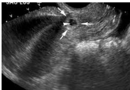
تصویر ۲- سونوگرافی مربوط به بیمار سوم و مشخص شدن ساک حاملگی ۶ هفته و ۵ روز در محل اسکار سزارین