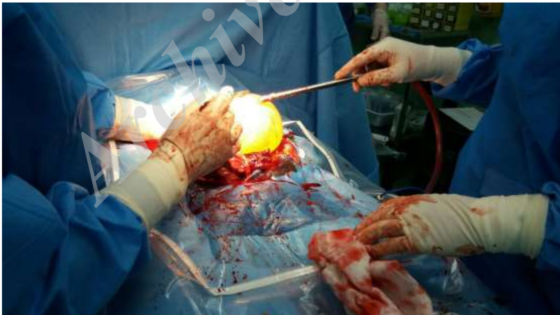
شکل ۱- نمای پارگی رحم همراه با کیسه حاوی جنین

خارج شد، اما جفت در محل کورنه تا سرویکس و تا لیگامان پهن دست‌اندازی کرده بود. خونریزی غیرقابل کنترل از محل تهاجم جفت وجود داشت. با توجه به اینکرتا بودن، هیستریکتومی انجام شد. از شروع تا پایان عمل حدود ۵/۵ لیتر خونریزی داشت. ۱۰ واحد پلاکت، ۷ واحد پکسل، ۷ واحد FFP و ۵ واحد کرایو تزریق گردید. بیمار در طی دریافت فرآورده‌های خونی دچار ادم ریه شد. برون‌ده ادراری وجود نداشت و بیمار با دریافت نوراپی‌نفرین فقط نبض (۱۳۰ بار در دقیقه) داشت. با توجه به چسبندگی و تهاجم شدید جفت با حضور متخصص اورولوژی سیستوسکوپی انجام شد. حالب سمت چپ بسته شده بود. با توجه به علائم حیاتی بیمار و عدم ثبات آن، شکم بیمار بسته و دو درن گذاشته شد. بیمار به صورت اینتوبه به ICU منتقل گردید. بیمار به تدریج دچار اختلال انعقادی شد. هموگلوبین به 5/8 گرم در دسی‌لیتر افت کرده بود همچنین پلاکت 152000 ، PT=12 ، PTT=35 ، فیبرینوژن 220 و INR=1/5 بود. در آزمایش ۶ ساعت بعد، هموگلوبین به 8/6 گرم در دسی‌لیتر رسید. همچنین پلاکت 93000 ،