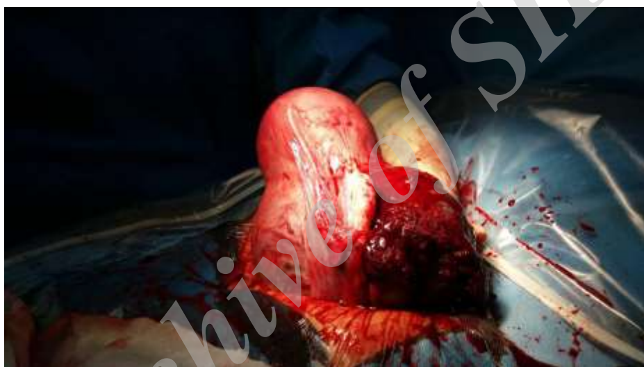
شکل ۳- نمای جانبی رحم همراه با پارگی