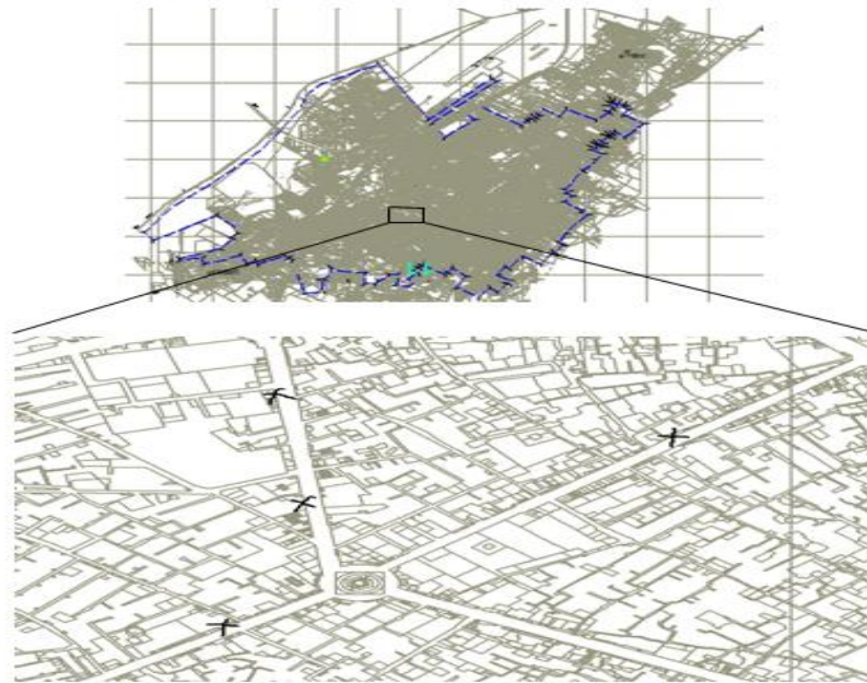
شکل ۳. نقشه شهر یزد و یک برش کوچک از آن شامل موقعیت مکانی مشتریان این محدوده

اجرا شد، که در تمام اجراها زمان رسیدن به جواب کمتر از ۸ دقیقه بود. جواب‌های بدست آمده از روش پیشنهادی با اطلاعات موجود از روش کنونی در جدول ۲ مقایسه شده است. روش معرفی شده موجب بهبود در مسافت کل حمل و نقل، و کاهش