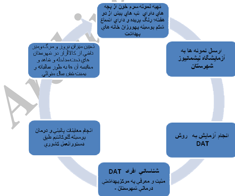
دیاگرام ۱- مراحل انجام مطالعه