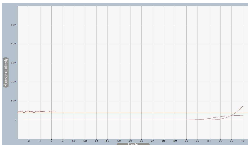
شکل ۳- نتیجه Real Time PCR منفی در جنس های استرپتومایسز، رودکوکوس، گوردونه، مایکوباکتریوم توبرکلوزیس به همراه چند سویه استاندارد از گونه های غیر آستروئیدس (شامل نوکاردیا برازیلینسیس، نوکاردیا کاویه و نوکاردیا سیرسیجرجیکا)