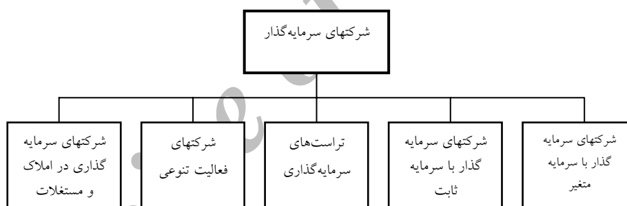
شکل ۲. ساختارهای مختلف شرکتهای سرمایه‌گذار

به دلیل ساختارها و بسترهای قانونی و اقتصادی؛ در حال حاضر از انواع ساختارهای شرکتهای سرمایه‌گذار، تنها ساختارهای شرکتهای سرمایه‌گذاری با سرمایه ثابت، شرکتهای