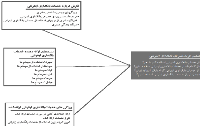
نمودار ۱. عوامل مؤثر بر تصمیم خرید مشتریان بانکداری اینترنتی

براساس بررسی‌های به‌عمل آمده درخصوص موضوع تحقیق، تمامی متغیرهای در نظر گرفته شده در مدل این تحقیق، در طیف وسیعی از پژوهش‌های انجام شده در این حوزه مورد استفاده قرار گرفته‌اند و فرضیه‌های تحقیق بر اساس طیف وسیعی از تحقیقات مورد حمایت قرار دارند. همچنین روایی ظاهری مدل با توجه به نظرات خبرگان بانکی و در نظر گرفتن شرایط ایران مورد بررسی و تأیید قرار گرفت. روایی ظاهری هنگامی برقرار است که فردی متخصص یا آزموده آن را بررسی نماید و نتیجه بگیرد که مدل از روایی لازم برخوردار است. متغیرهای مؤثر بر تصمیم خرید مشتریان بانکداری اینترنتی مورد بررسی در این پژوهش، در نمودار (۱) به تصویر کشیده شده است.