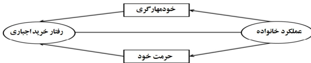
شکل ۱: مدل مفهومی پژوهش