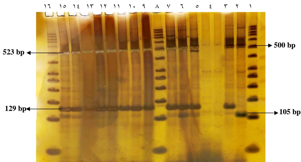
شکل 2: PCR ترکیبی بر روی ژل پلی اکریل آمید 8

* خط 1 و 10 و 18 مارکر، خط 2 تا 9 و 11 تا 16 نمونه بیجینگ، خط 17 نمونه غیر بیجینگ، خط 14 و 15 کمبود DNA نمونه (مارکر 50 bp خریداری شده از شرکت سیناژن).