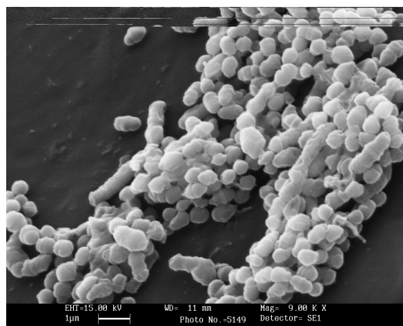
الف) بعد از ۲۴ ساعت