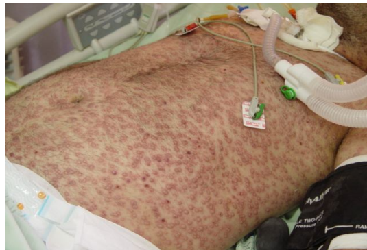
1. ضایعات بیمار قبل از درمان