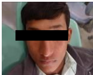
تصویر 1. تورم منتشر در سمت چپ صورت که باعث محو شدن چین نازولیبال شده است

پسر 19 ساله ای با تورم سمت چپ صورت از یک ماه قبل، به بخش بیماری‌های دهان دانشکده دندانپزشکی مشهد مراجعه کرده بود. رشد ضایعه سریع بوده و در عرض یک ماه اندازه آن بسیار افزایش یافته بود. در معاینه خارج دهانی تورم مختصری در سمت چپ صورت مشاهده شد که موجب از بین رفتن چین نازولیبال شده بود (تصویر 1). پارستزی، انسداد یا ترشحاتی از بینی وجود نداشت. پوست صورت نرمال بود و تغییر رنگی مشاهده نمی‌شد. ناحیه متورم هیچ افزایش دمای موضعی نداشت. در لمس گروه های لثی ناحیه هیچ گونه لنفادنوپاتی گزارش نگردید.