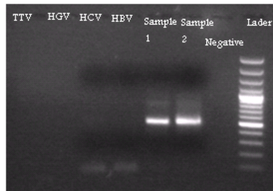
شکل 2. باند بهینه سازی شده HIV به همراه کنترل مثبت و منفی