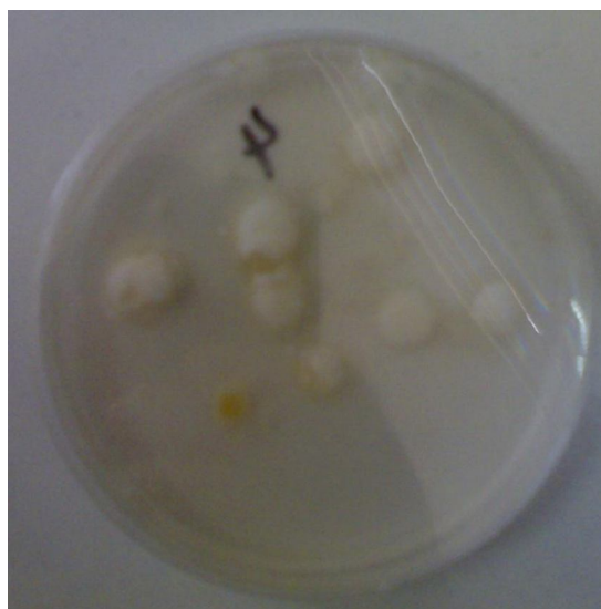
شکل 1: کلنی‌های خالص ساپروولگنیا پارازیتیکا در محیط کشت YGC

پس از تعیین جنس قارچ با استفاده از روش‌های فنوتیپی (موفولوژی)، جهت تعیین گونه از روش‌های ژنوتیپی استفاده گردید. ابتدا آزمایش تقویت واکنش زنجیره‌ای پلیمرز (PCR amplification) انجام شد که به علت اهمیت توالی ناحیه ITS در تشخیص قارچ‌ها و حفاظت شده بودن این توالی که مربوط به ژن rDNA است با استفاده از آغازگرهای مربوط به این توالی یعنی ITS1 و ITS4 تکثیر انجام و قطعه‌ای حدود 550 جفت باز تکثیر گردید (شکل 2).