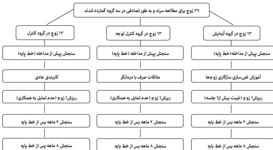
نمودار ۱. شیوه اجرا

دو ماه بعد از خط پایه (مرحله پس از مداخله) و ۸ ماه بعد از خط پایه (مرحله پیگیری) شرکت‌کنندگان مجدد مورد سنجش قرار گرفتند و داده‌های جمع‌آوری شده با استفاده از آزمون‌های آماری توصیفی (میانگین، انحراف معیار) و استنباطی (تحلیل واریانس با اندازه‌گیری مکرر، آزمون کالموگروف - اسمیرنوف و کرویت موجلی) با کمک نرم‌افزار SPSS-21 تجزیه و تحلیل شد. در نمودار شماره ۱ شیوه اجرا نشان داده شده است.