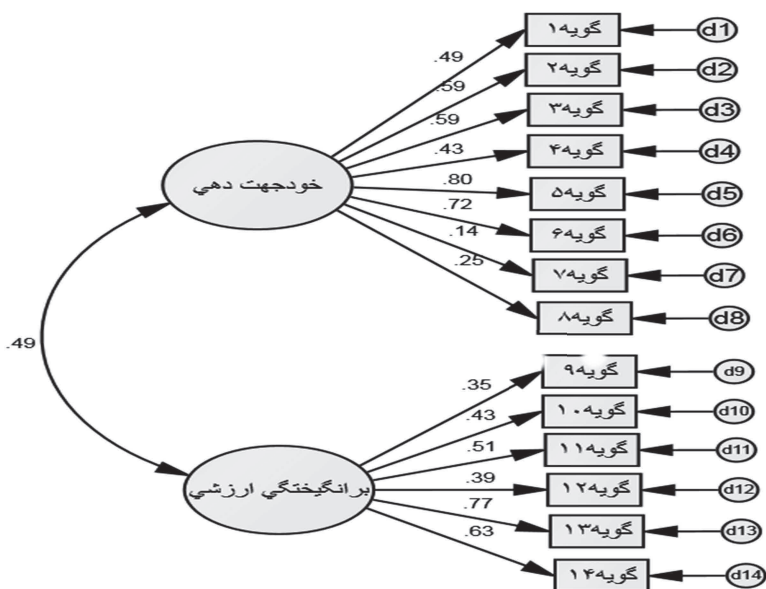
شکل ۲. بارهای عاملی استاندارد مدل دو عاملی مرتبه‌ی اول مقیاس نگرش‌های مسیر شغلی متنوع