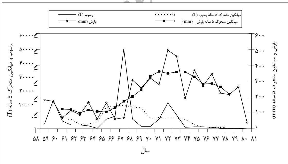
شکل ۲: نمودار روند تغییرات و میانگین متحرک پنج ساله رسوب و بارش سالیانه در حوضه آبخیز مندریجان