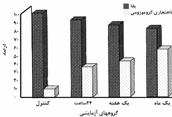
شکل ۲: نمودار مقایسه‌ای در صد بقاء و ناهنجاری‌های کروموزومی جنین ۸ سلولی موش در زمان‌های مختلف پس از انجماد.

نتایج حاصل از بررسی میزان وقوع ناهنجاری‌های کروموزومی در جنین‌ها پس از انجماد در جدول ۲ و شکل ۲ ارائه شده است. درصد ناهنجاری‌های کروموزومی از نوع آنیوپلوئیدی در گروه کنترل، ۸/۳\% می‌باشد. با افزایش زمان انجماد میزان این ناهنجاری‌ها افزایش می‌یابد و سپس حالت یکنواخت به خود می‌گیرد. به طوری که در گروه ۲۴ ساعت، ۳۲/۳\% ، در گروه یک هفته، ۲۶/۵\% و در گروه یک ماه، ۲۶/۳\% می‌باشد (شکل ۲). با مقایسه گروه ۲۴ ساعت با گروه کنترل، وقوع آنیوپلوئیدی ۲۴\% افزایش یافت ( p = 0/004 ) و در مقایسه گروه یک هفته با گروه کنترل این میزان افزایشی معادل ۱۸/۲\% ( p = 0/018 ) و گروه یک ماه نسبت به گروه کنترل افزایش ۱۷ درصدی ( p = 0/016 ) را نشان داد که از نظر آماری کاملاً معنی‌دار است.