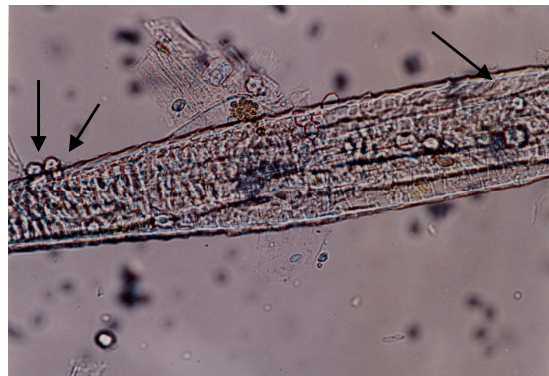
شکل ۲- اشکال میکروسکوپی موهای آلوده به اسپور (راست) و میسیلیوم (چپ) قارچ‌های درماتوفیت کوچک هندی که به کمک محلول پتاس ۱۰٪ شفاف شده‌اند (۱۰x).

قارچی که در محیط S در لوله پرورش یافته‌اند استفاده شد. قبل از تلقیح، مقدار ۳ تا ۵ میلی‌لیتر سرم فیزیولوژی استریل به کشت‌های مورد نظر اضافه شد و پس از جدا کردن کلنی توسط نیدل در داخل لوله آزمایش و مخلوط کردن آن با سرم فیزیولوژی، سوسپانسیون قارچی مناسب توسط دستگاه اسپکتوفتومتر (محلولی با حدود 10^6 سلول در هر میلی‌لیتر) جهت تلقیح جلدی تهیه شد. لازم به ذکر است که کلیه آزمایشات سه بار تکرار شده و نهایتاً پس از جمع‌آوری داده‌ها با توجه به توزیع نرمال، تمامی یافته‌ها با روش‌های آماری آنالیز واریانس یک طرفه (ANOVA) آنالیز شد.