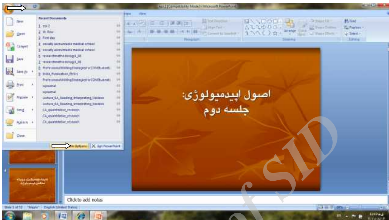
تصویر ۱- نمایش چگونگی دسترسی به دایره منتهی الیه سمت چپ و بالای صفحه نمایش و انتخاب گزینه (PowerPoint Options) در انتهای صفحه جدید

چنین فونت‌هایی را نداشته باشد، در نمایش اسلایدهای شما مشکلی پیش نخواهد آمد.