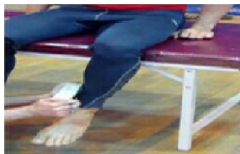
۱۴ ارزیابی قدرت چرخش خارجی ران