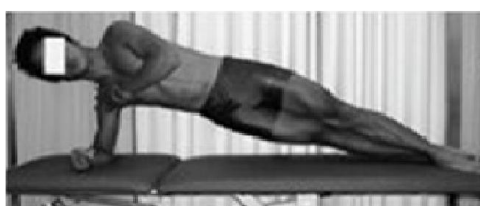
d. آزمون پلانک از طرفین