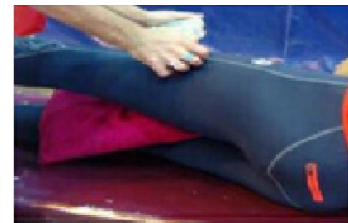
۱۳ ارزیابی قدرت دور کردن ران