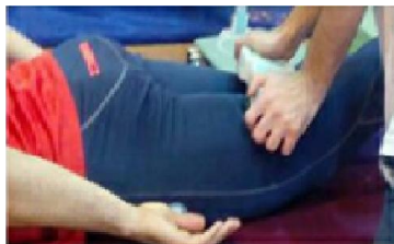
۱۵ ارزیابی قدرت راست کردن ران