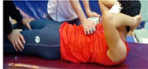
۱۱ ارزیابی قدرت خم کردن تنه