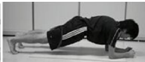
c. آزمون پلانک از جلو

شکل ۱- آزمون های استقامت ناحیه مرکزی بدن