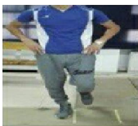
۳c. آزمون پرش جانبی

در آزمون پرش جانبی آزمودنی کنار خط شروع با پاییی که قصد داشت، آزمون را انجام دهد (پای برتر) می‌ایستاد و پای دیگرش را کمی از مفاصل ران و زانو خم می‌کرد تا با زمین برخورد نداشته باشد، سپس آزمودنی به تعداد ۱۰ بار به صورت رفت و برگشت با حداکثر سرعت، فاصله ۳۰ سانتی‌متری که با دو تکه چسب کاغذی موازی روی زمین مشخص شده بود را به صورت لی لی به کنار طی می‌کرد و زمان طی شده با دقت ۰/۰۱ ثانیه به عنوان امتیاز او ثبت