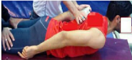
۱۲ ارزیابی قدرت راست کردن تنه