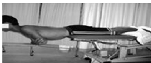
b. آزمون استقامت راست کردن تنه

آزمون راست کننده تنه یا همان آزمون Biering sorensen برای سنجش توانایی عضلات خلفی ناحیه مرکزی بدن به ویژه راست کننده ستون فقرات انجام می-شود. آزمودنی به حالت دمر، طوری که لگن در لبه تخت درمانی قرار گیرد، می-خوابد. یک استرپ برای تثبیت فرد روی تخت در قسمت مچ پا محکم بسته می-شود. آزمودنی در حالی که دستها را به شکل ضربدری روی سینه حفظ کرده است، بالاتنه خود را به صورت افقی نگه می-دارد. مدت زمان حفظ این وضعیت به عنوان استقامت راست کننده تنه او ثبت می-شود. آزمون پلانک به طرفین به عنوان مقیاسی برای ارزیابی عضلات جانبی قسمت مرکزی بدن، به ویژه مربع کمری