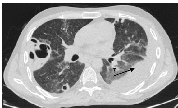
تصویر ۳- ضایعه اوپاک در ریه سمت چپ (پیکان ۱) به همراه کاویته در ریه سمت راست (پیکان ۲) در HRCT