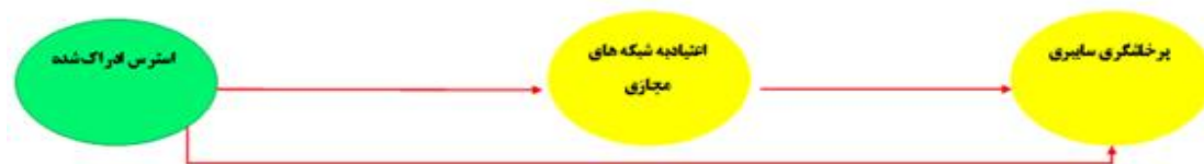
نمودار ۱- مدل مفهومی پیش‌بینی پرخاشگری سایبری دانشجویان دانشکاه محقق اردبیلی در سال ۱۳۹۸ بر اساس استرس ادراک شده با میانجی‌گری اعتیاد به شبکه‌های مجازی

این‌گونه تعریف کردند، بودن بیش‌ازحد در شبکه اجتماعی و یا اختصاص زمان بسیار و تلاش برای ماندن در شبکه‌های اجتماعی که باعث اختلال در فعالیت‌های اجتماعی، مطالعات، شغل، روابط بین فردی و سلامت روانی فرد می‌شود [۱۴]. دانش‌جویان مقدار قابل توجهی از وقت خود را (به طور متوسط چندین بار در روز) صرف برقراری ارتباط از طریق پیام‌های متنی و اجتماعی می‌کنند [۱۵]. هرچند امروزه استفاده از شبکه‌های مجازی تبدیل به یک رفتار مدرن طبیعی شده است ولی شکل‌های آسیب‌زای استفاده از آن‌ها هم در دو دهه اخیر مورد توجه زیادی قرار گرفته است [۱۶]. نتایج پژوهش‌ها و همبستگی‌های به دست آمده نشان‌گر وجود مشکلات عاطفی، ارتباطی، عملکردی و مرتبط با سلامت در معتادان به شبکه‌های اجتماعی است [۱۷]. مطالعات زیادی نشان می‌دهد که وابستگی به شبکه‌های اجتماعی به عوارض شدید منفی از جمله سلامت روان، کیفیت خواب، ارتباط بین‌فردی و عملکرد تحصیلی می‌انجامد [۱۸].