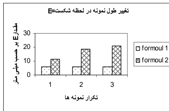
نمودار ۱ میزان تغییر طول نمونه در لحظه شکست