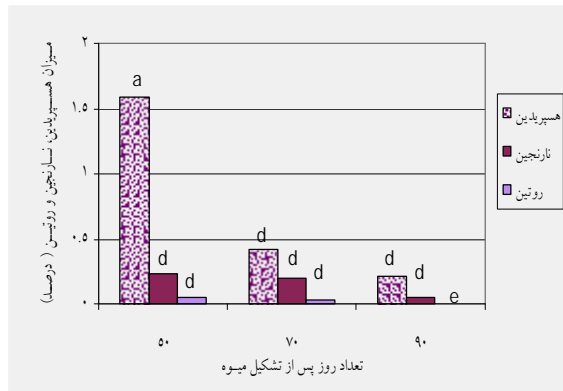
شکل ۲ تغییرات میزان فلاونوئیدها در پوست میوه در مراحل مختلف برداشت

درصد وزن خشک) و کمترین میزان آن، مربوط به ۹۰ روز پس از تشکیل میوه (۰/۰۲۶ درصد وزن خشک) بود.