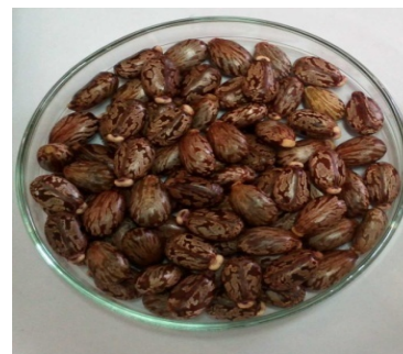
شکل ۱ دانه کرچک وارپته اصفهان

عصاره گیری به روش خیساندن انجام شد. ابتدا ۵۰ گرم دانه کرچک در آسیاب خرد و سپس با آب مقطر استریل به حجم ۲۰۰ میلی لیتر رسیده و طی ۷۲ ساعت در دمای محیط تکان داده شد. در ادامه با کاغذ صافی استریل، عصاره ها صاف و عصاره های حاصل به طور جداگانه در پلیت های شیشه ای ریخته شد. به منظور خشک کردن، عصاره ها در آون با دمای ۸۳ درجه سانتی گراد به مدت ۲ روز قرار گرفت، بعد این مدت، عصاره های خشک شده توسط اسپاتول جدا شده و پودر حاصل از آن توزین شد. هر کدام از پودر عصاره های کرچک وارپته مشهد و اصفهان در ظروف شیشه ای درب دار استریل، که در فویل آلومینیم پیچیده شده بودند، قرار داده شد و تا زمان استفاده در یخچال مورد نگهداری قرار گرفت [۱۰].