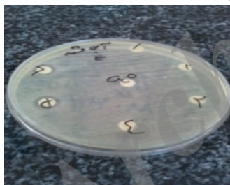
شکل 4 قطر هاله مهار رشد عصاره آبی مشهد بر روی اشرشیاکلی