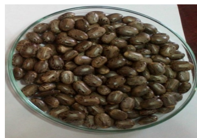
شکل ۲ دانه کرچک وارپته مشهد