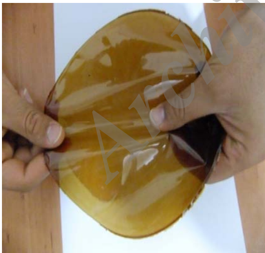
شکل ۲ نمونه‌ای از فیلم تهیه شده از پروتئین‌های دانه گاودانه

با توجه به اندیس‌های رنگ (=سیاه و =سفید) L، (سبز = a، قرمز = +a) و (آبی = -b، زرد = +b)، فیلم‌های حاصله با اندیس L، a و b ۳۲/۴۳، ۲۲/۴۱ و ۳۷/۲۰ (به ترتیب) قرمز تا قهوه‌ای روشن بودند. در مقایسه با سایر فیلم‌های پروتئینی مانند عدس، فیلم‌های گاودانه اندیس‌های L، a و b بیشتری داشتند و در مقایسه با فیلم سویا، اندیس L به مراتب کمتر و اندیس‌های a و b بیشتری را نشان دادند (۸،۹). مشخص شده که رنگ فیلم علاوه بر طبیعت ماده مورد استفاده، تحت تاثیر دما و pH نیز قرار می‌گیرد. هر چه دما و pH بالاتر باشد فیلم‌های حاصله تیره‌تر خواهند بود زیرا حلال‌های قلیایی نسبت به سایر حلال‌ها، رنگدانه‌ها را بیشتر استخراج می‌کنند (۸). طبیعی است هر چه دما بالاتر باشد، سرعت و شدت استخراج رنگدانه‌ها نیز بیشتر خواهد بود. البته باید توجه داشت که رنگ فیلم عامل مهمی در کاربرد آن به شمار می‌آید. رنگ نسبتا تیره فیلم حاصل از گاودانه نشان می‌دهد که این فیلم برای بسته‌بندی موادی که نسبت به نور حساس هستند مناسب می‌باشد. در شکل ۲ نمونه‌ای از فیلم تهیه شده از پروتئین دانه گاودانه قابل مشاهده است.