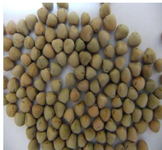
شکل ۱ تصویری از دانه‌های گاودانه مورد استفاده در این تحقیق

میزان پروتئین آرد دانه گاودانه و کنسانتره پروتئینی آن به ترتیب ۲۷/۶۲ و ۸۶/۴۵ براساس وزن خشک به دست آمد. در تحقیقات دیگر نیز میزان پروتئین دانه گاودانه در محدوده ۲۰/۱ تا ۳۲/۳۲٪ براساس وزن خشک گزارش شده است [۲۱]. میزان پروتئین گاودانه قابل مقایسه با پروتئین نخود (۲۷٪) و بیشتر از عدس ۲۳/۳۲٪ می‌باشد [۱۰،۸]. میزان پروتئین کنسانتره تهیه شده نیز نشان می‌دهد که pH های انتخاب شده در مرحله استخراج پروتئین از دانه‌های آسیاب شده گاودانه نیز در محدوده مناسبی بوده‌اند و حتی با اندکی خلص سازی می‌توان به راحتی میزان پروتئین آن را به بالای ۹۰٪ رساند و ایزوله پروتئینی به دست آورد. با توجه به عوامل محدود کننده تغذیه‌ای که در دانه گاودانه وجود دارد [۱۴] و با توجه به مقدار پروتئین نسبتا بالای آن در مقایسه با سایر منابع گیاهی، این دانه پتانسیل بسیار خوبی برای تهیه فیلم‌های پروتئینی دارد. در شکل ۱ تصویری از دانه‌های گاودانه مورد استفاده در تهیه فیلم پروتئینی آورده شده است.