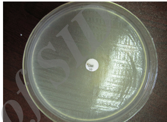
شکل ۶ قطر هاله مهارکننده، آنتی‌بیوتیک جنتامایسین روی باکتری استافیلوکوکوس اورئوس