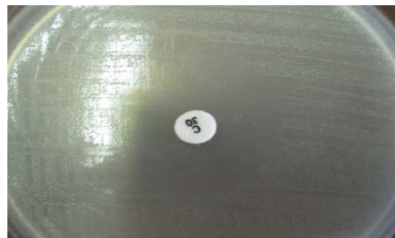
شکل ۷ قطر هاله مهارکننده، آنتی‌بیوتیک کلرامفنیکل روی باکتری اشرشیاکلی