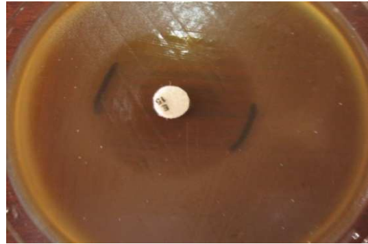
شکل ۵ قطر هاله مهارکننده، آنتی‌بیوتیک اریترومايسين روی باکتری لیستریا مونوسیتوژنر