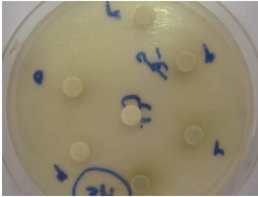
شکل ۳- قطر هاله مهارکننده، عصاره اتانولی آلوئه ورا روی باکتری