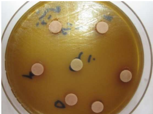
شکل ۴ قطر هاله مهارکننده، عصاره اتانولی آلوئه ورا روی باکتری