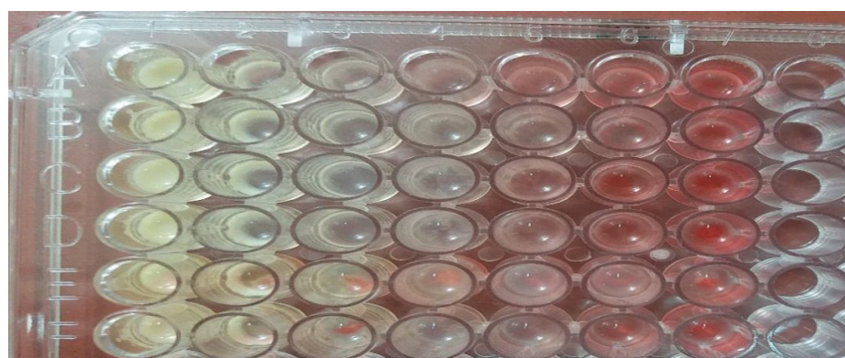
Fig 3 MIC of the Citrus aurantium essential by microdilution broth method.

linalyl acetate (۰/۷۷ تا ۲۴/۷۷٪) و \alpha -terpineol (۹/۲۹ تا ۱۲/۱۲٪) اجزای اصلی اسانس بهار نارنج می‌باشد. این محققین تفاوت میان میزان ترکیبات شناسایی شده در اسانس بهار نارنج را به تفاوت‌های اکولوژیکی، زمان برداشت، آب و هوا، دمای رشد و ... نسبت دادند [۱۶]. سارو و همکاران (۲۰۱۳)، ترکیبات شیمیایی اسانس بهار نارنج را مورد شناسایی