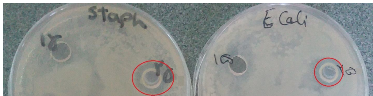
Fig 2 Inhibition zone diameters of Citrus aurantium essential oil on Escherichia coli and Staphylococcus aureus at concentration of 25 mg/ml.