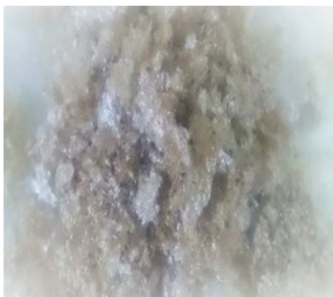
Fig 2 Gum made from Lallelantia royleana seed

دانه‌ی بالنگو از تهران خریداری و آلودگی‌های ثانویه‌ی آن‌ها حذف شد. ابتدا دانه‌های بالنگو به مدت ۲۰ دقیقه درون آب مقطر با دمای 25^{\circ}\text{C} در pH برابر ۷ و نسبت آب به دانه برابر ۲۰ به ۱ قرار گرفت [۱۸]. مدت زمان ۲۰ دقیقه توسط اکستراکتور خانگی (آب‌میوه‌گیری) با مدل (MJ - , japan) (Panasonic, J176P) استخراج [۷] و محلول صمغ از صافی‌های توری با قطر منافذ 20\mu\text{m} عبور داده شد [۱۹] و موسیلاژ بدست آمده در آون ( 105^{\circ}\text{C} و ۴ ساعت) خشک گردیده شد و بوسیله آسیاب (SUNNY, SFP-820, China) به پودر تبدیل شد [۷].