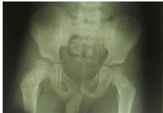
شکل شماره ۳. رادیوگرافی در پیگیری دو ساله بیمار