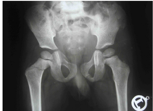
شکل شماره ۱. رادیوگرافی لگن بیمار در موقع ورود به اورژانس

تخلیه شد که هم تاییدی بر وجود شکستگی باشد و هم از نظر تئوری فشار وارد بر سر فمور کاهش یابد. پس از عمل گچ اسپایکای دوطرفه گرفته شد (شکل شماره ۲). بیمار هر دو هفته یکبار ویزیت و نهایتا هشت هفته بعد بین ها خارج شد. در پیگیری دو سال پس از عمل جراحی بیمار بدون لنگش راه می رفت و والدین نیز مشکلی را ذکر نمی کردند. در معاینه هیچ گونه اختلاف طول دو اندام وجود نداشت. رادیوگرافی در این زمان هیچ نشانه ای از نکروز آواسکولار سر فمور نداشت و حتی اسکار شکستگی ها نیز دیده نمی شدند (شکل شماره ۳).