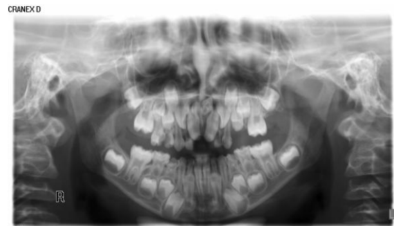
شکل ۱. تصویر پانورامیک از یک دختر ۸ ساله که دارای ۲ دندان مزیودنس که در سمت راست بصورت عمودی و معکوس قرار گرفته است

این مطالعه مقطعی بر روی ۲۰۰۰ رادیوگرافی پانورامیک انجام شده در مطب های تخصصی اطفال و بخش اطفال دانشکده دندانپزشکی دانشگاه علوم پزشکی بابل صورت گرفت. بیماران با سن ۷-۱۲ سال، واجد رادیوگرافی پانورامیک با کیفیت مطلوب وارد مطالعه شدند. بیماران سندرومیک با احتمال وجود دندانهای اضافه و متعدد از مطالعه خارج شدند. در رادیوگرافی پانورامیک، در موارد مشکوک به وجود مزیودنس از رادیوگرافی پری اپیکال نیز استفاده گردید. سپس در پرسشنامه ای که بر این اساس طراحی شده است بر اساس تعداد دندان های مزیودنس، شکل (مخروطی، شبه انسیزور، بدشکلی (Malform))، وضعیت قرارگیری (عمودی، معکوس و افقی)، مشکلات همراه با دندان های مزیودنس (تأخیر در رویش، دیاستم در میدلاین چرخش، آسیمتری میدلاین و وجود کیست دنتی ژروس) و شیوع بر اساس جنسیت و سن، اطلاعات ثبت شد (شکل ۱). دو متخصص رادیولوژی دهان، فک و صورت به عنوان مشاهده گر رادیوگرافی ها را بطور همزمان بررسی نمودند. سپس اطلاعات جمع آوری شده در نرم افزار SPSS ver.20 با استفاده از آمار های توصیفی (میانگین، انحراف معیار، درصد شمارش موارد در هر متغیر) گزارش شد.