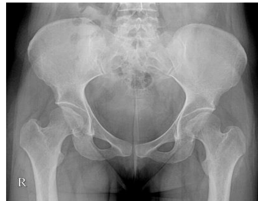
شکل ۲. گرافی لگن