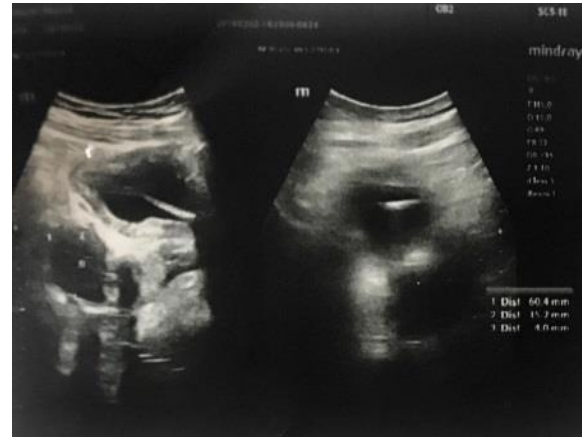
شکل ۱. ناحیه اکوژن خطی مایل به طول ۷۱ میلی‌متر مطرح کننده جسم خارجی داخل مثانه

احتمال جسم خارجی مطرح شده بود (شکل ۱). در ادامه به متخصص اروولوژی ارجاع شد بعد از بستری گرافی لگن انجام شد که هیچ یافته‌ای مشاهده نشد (شکل ۲). بدنبال آن در سی‌تی‌اسکن اسپیرال شکم و لگن بدون تزریق و بدون کنتراست خوراکی تصویر جسم خارجی در مثانه مسجل شده (شکل ۳ و ۴) و بیمار کاندید سیستوسکوپی شد.