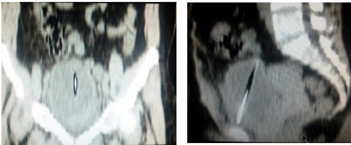
شکل ۴ و ۵. تصویر جسم خارجی دیده شده در سی‌تی‌اسکن اسپیرال شکم و لگن بدون کنتراست تزریقی و خوراکی (نمای سائیتال و کروئال)

در سیستوسکوپی انجام شده ابتدا نکته ای مشاهده نشد ولی در ادامه بررسی جسم خارجی در سقف مثانه با دقت بیشتر مشاهده شد. از آنجا که امکان خروج به راحتی ممکن نبود. ابتدا با سنگ شکن مکانیکال نوک مداد را شکسته سپس با گرسپر از سوراخ نوک مداد بطور طولی بدون تروما به مجرا خارج شد (شکل ۶).