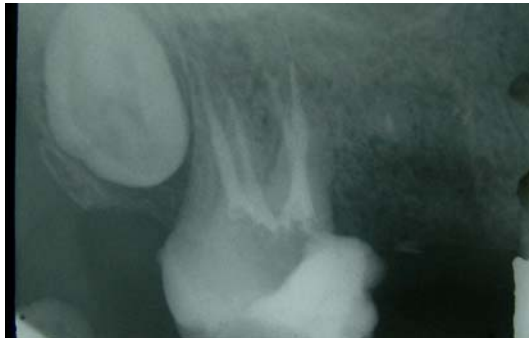
تصویر ۳: رادیوگرافی پرکردگی کانال دندان