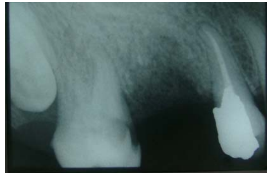
تصویر ۱: رادیوگرافی اولیه بیمار

دستی Ni-Ti انجام شد. کانالها توسط گوتا پرکا همراه با سیلر AH26 با روش تراکم لترالی پر شد و تاج دندان توسط پنبه استریل و ماده پرکننده موقت پانسمان گردید (تصویر ۳)، سپس بیمار جهت ترمیم دائمی تاج دندان معرفی گردید. در کنترل ۶ ماه بعد از درمان، بیمار مشکل خاصی نداشت (تصویر ۴).