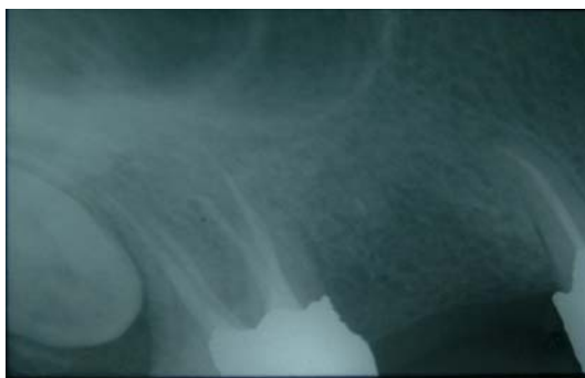
تصویر ۴: رادیوگرافی کنترل ۶ ماه بعد از درمان

بجز گشادی PDL، رادیولوسنسی و ضایعه ای در ناحیه پری آپیکال مشاهده نشد. تشخیص پالپایتیس برگشت ناپذیر و طرح درمان، معالجه ریشه دندان مورد نظر گذاشته شد. بیمار از لحاظ پزشکی مشکل خاصی نداشت.