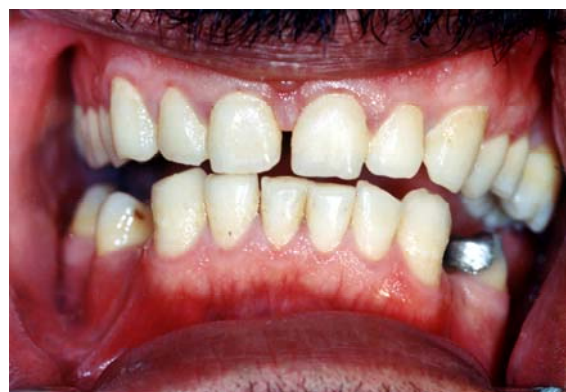
شکل ۳: تصویر نمونه ای از گروه آزمون (آب اکسیژنه و کلرگزیدین) در انتهای مطالعه