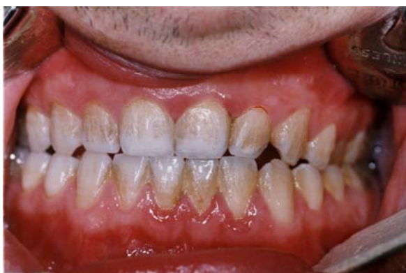
شکل ۴: تصویر نمونه ای از گروه کنترل (کلرگزیدین) در انتهای مطالعه