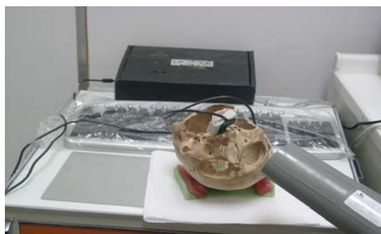
شکل ۲: نحوه عکسبرداری با دستگاه رادیوگرافی دیجیتال