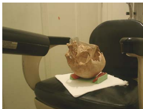
شکل ۱: نحوه عکسبرداری با دستگاه رادیوگرافی معمولی

آشکار ساز (Sensor) مورد استفاده ساخت پلن مگا فنلاند بود که اندازه ای حدوداً 23/1 \times 40/8 داشت. Resolution سیستم به میزان 26^{pl}/mm تعریف شده است و اندازه پیکسل های تصویر بوجود آمده حدوداً 30 \mu m می باشد که در فرمت ۱۲ بیتی توانایی نشان دادن 4096 سایه خاکستری متفاوت را دارد (محدوده پویای 2^{12} است).