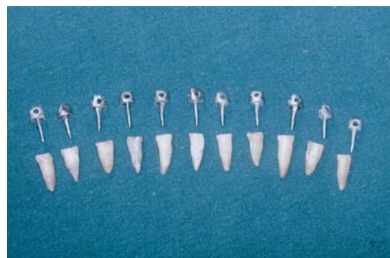
تصویر ۱: آماده کردن و نشانیدن پست کورها

بعد از این مرحله، دندانها در مرکز سیلندر به قطر ۱/۵ و ارتفاع ۲/۵ سانتیمتر که درون آن از آکریل پر شده بود، قرار داده شد تا به راحتی در جیگ فک پایین دستگاه کشش قرار گیرد (تصویر ۲).