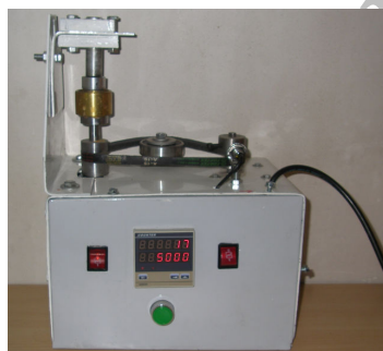
تصویر ۳: دستگاه دارای یک بورد دیجیتالی می باشد.

در این مطالعه دستگاه سایش مخصوصی طراحی و ساخته شد (تصویر ۳). اجزاء این دستگاه شامل یک هولدر آلومینیومی بود که نمونه‌ها در داخل آن قرار می‌گرفتند و توسط پیچ محکم می‌شدند. هولدر می‌توانست آزادانه بالا و پائین برود. بنابراین با وجود سایش نمونه‌ها، نیروی اعمال‌شده همیشه یکسان بود. دستگاه دارای یک محفظه برنجی بود که در داخل آن بزاق مصنوعی ریخته می‌شد در کف محفظه دیسک اکسید آلومینیوم قرار داشت که توسط یک پیچ محکم می‌شد، نمونه‌های دندانی در شعاع ۱ cm از مرکز قرار داده شدند.