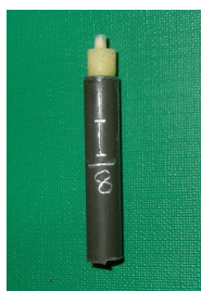
تصویر ۲: نمونه‌های دندانی متصل شده به لوله های فلزی

در این مطالعه دستگاه سایش مخصوصی طراحی و ساخته شد (تصویر ۳). اجزاء این دستگاه شامل یک هولدر آلومینیومی بود که نمونه‌ها در داخل آن قرار می‌گرفتند و توسط پیچ محکم می‌شدند. هولدر می‌توانست آزادانه بالا و پائین برود. بنابراین با وجود سایش نمونه‌ها، نیروی اعمال‌شده همیشه یکسان بود. دستگاه دارای یک محفظه برنجی بود که در داخل آن بزاق مصنوعی ریخته می‌شد در کف محفظه دیسک اکسید آلومینیوم قرار داشت که توسط یک پیچ محکم می‌شد، نمونه‌های دندانی در شعاع ۱ cm از مرکز قرار داده شدند.