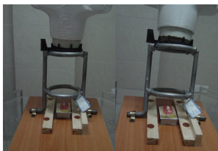
تصویر ۲: نحوه تنظیم تیوب با و بدون زاویه

در حفرات اسیدی میزان تشخیص صحیح اندودنتیست ۶۷/۲٪ و میزان تشخیص صحیح رادیولوژیست ۱۳/۹٪ بود که در مجموع اختلاف آماری قابل توجهی را نشان ندادند ( P=0.31 ).