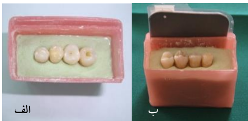
تصویر ۱ (الف، ب): یک نمونه باکس آکریلی-گچی حاوی دندان‌های مورد مطالعه و محل قرارگیری سنسور

چنین ارزیابی‌هایی برای قوس‌های دو و سه و چهار نیز صورت گرفت. سپس اطلاعات حاصل به نرم‌افزار SPSS با ویرایش ۱۶ منتقل شد و آزمون آماری غیرپارامتریک Kruskal-wallis بر روی نمره مشاهده‌گران برای بررسی اثر تاخیر در اسکن PSP در کیفیت تشخیصی نوک ریشه در شرایط نگهداری مختلف انجام شد.