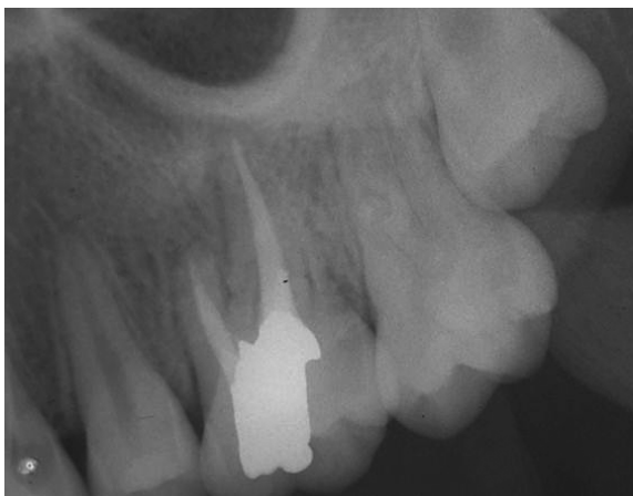
شکل ۴: رادیوگرافی تهیه شده ۱ سال بعد از جراحی