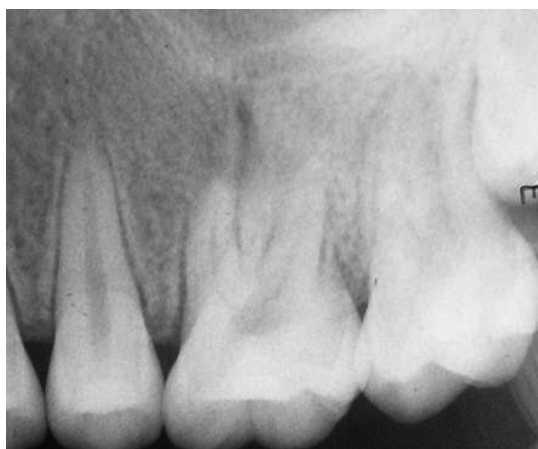
شکل ۱: رادیوگرافی اولیه

تماس‌های اکلوزالی مجدد چک شد و دندان مورد نظر به طور کامل از اکلوزن خارج شد. فالوآپ ۱۰ روز و یک سال (شکل ۴) بعد مجدد انجام شده و بهبودی کامل کلینیکی مشاهده شد.