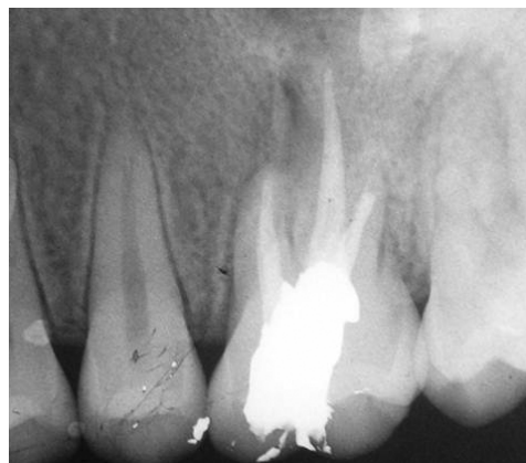
شکل ۲: رادیوگرافی تهیه شده بلافاصله بعد از RCT و پر کردن با آمالگام