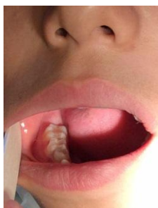
شکل ۲: تورم در نمای باکال فک پایین سمت راست بیمار

استئوسارکوم فکین برخلاف استخوان‌های دراز معمولاً عود می‌کند و عود موضعی آن شایع تر از متاستاز است. (۱) این مقاله گزارش یک مورد نادر از استئوسارکوم فیبروبلاستیک فک پایین در دختر ۸ ساله می‌باشد که تشخیص آن به لحاظ شباهت با ضایعه خوش خیم فیروز دیسپلازی و نادر بودن سن بروز آن، بسیار چالش برانگیز بود.