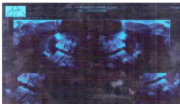
شکل ۳: نمای رادیوگرافی پانورامیک که نشان دهنده ضایعه لوسنت در خلف فک پایین در سمت راست بیمار همراه با تحلیل ریشه دندانهای مولر فک پایین

ماگزیرا را با یک نسبت درگیر می‌کند. (۲) علت دقیق استئوسارکوم ناشناخته است. با این حال، تعدادی از عوامل خطر در ایجاد این بیماری نقش عمده‌ای دارند که شامل عوامل محیطی مانند رادیاسیون یونیزاسیون و زمینه ژنتیکی می‌باشد. (۱۵و۱۴) معمولاً افزایش شیوع این ضایعه، در بیماران با سابقه پاژت و رادیوتراپی قبلی دیده شده است. (۱۶) در مطالعه‌ای که در آمریکا بر روی ۱۳ بیمار مبتلا به استئوسارکوم صورت گرفت، مشخص شد که ۲ نفر سابقه رادیوتراپی و ۱ نفر نیز مبتلا به بیماری پاژت بوده است. (۱۶) استئوسارکوم ایتترامدولاری از نظر هیستوپاتولوژی به سه دسته استئوبلاستیک، کندروبللاستیک و فیبروبلاستیک تقسیم می‌شود و در مطالعات مختلف نوع کندروبللاستیک به عنوان شایع‌ترین و نوع فیبروبلاستیک نیز کمترین درصد را به خود اختصاص می‌دهد. (۱) در نمونه بررسی شده مطالعه حاضر، مواد استئوئید توسط سلول‌های بدخیم آتیپیک ساخته شده بود و در لابه‌لا نیز نواحی کوچکی از تراکول‌های استخوانی مشهود بود که در اطراف توسط سلول‌های دوکی هایپرکروم با الگوی گریزادی احاطه شده بود و این تومور در ابتدا فیروز دیسپلازی تشخیص داده شده بود. بیشتر استئوسارکوماهای فکی (۸۷ درصد) بدخیمی‌های با درجات بالا و تمایز کم به شمار می‌روند در حالی که برخی از آنها درجه پایین و تمایز بالا هستند که به تنه فک پایین تمایل نشان می‌دهند. (۱۷) اینگونه از استئوسارکوم با درجه بدخیمی پایین و تمایز بالا ممکن است حداقل آتی پی سلولی و شکل گیری استخوان را نشان دهد و در نتیجه در بررسی میکروسکوپی ممکن است تشخیص این ضایعات از ضایعات استخوانی خوش خیم مانند فیروز دیسپلازی یا فیرومای اسفیه مشکل باشد (۱۸) ولی با بررسی دقیق و مشاهده استئوئید تولید شده توسط سلول‌های هایپرکروم و