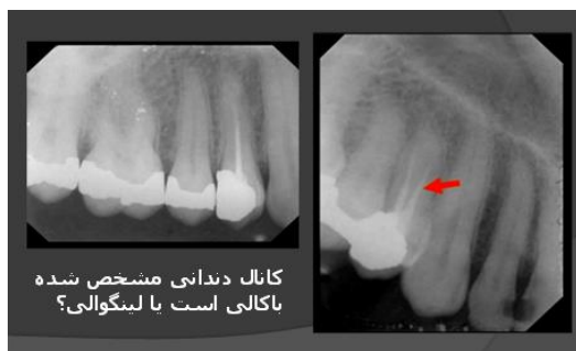
کانال دندانی مشخص شده باکالی است یا لینگوالی؟

تصویر ۲. اسلاید اول آزمون لوکالیزاسیون، با جابجایی تیوب به سمت دیستال، شی جابجایی مزیاالی دارد که مشخص کننده موقعیت باکالی آن است