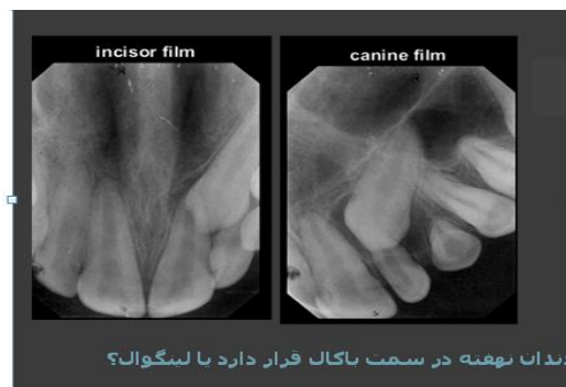
تصویر ۴. اسلاید سوم آزمون لوکالیزاسیون، با توجه به جابجایی دیستالی موقعیت دندان پس از جابجایی دیستالی تیوب، دندان نهفته در سمت پالاتال قرار دارد

در جدول ۱ مشاهده می‌گردد که در گروه آموزش عملی، در آزمون اول، کمترین نمره ۳ بوده است؛ در حالیکه در آزمون دوم، کمترین نمره ۲ بوده است؛ در گروه آموزش تئوری صرف، در هر دو آزمون اول و دوم کمترین نمره ۱ بوده است. برای هر یک از گروههای آموزش عملی و آموزش تئوری صرف، بین آزمون اول و دوم مقایسه انجام گرفت و مشخص شد در گروه آموزش عملی، اختلاف توزیع نمرات بین دو آزمون معنی‌دار نبود ( P=0/782 ). همچنین در گروه آموزش تئوری صرف نیز اختلاف توزیع نمرات بین آزمون اول و دوم معنی‌دار نبود. ( P=0/130 )