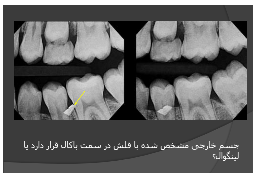
جسم خارجی مشخص شده با فلش در سمت باکال قرار دارد یا لینگوال؟

با استفاده از حفرات متعدد ایجاد شده در صفحه چوبی امکان تغییر موقعیت میله‌ها نسبت به هم فراهم شد. همچنین در این دستگاه از پرده‌ای چوبی با قابلیت تغییر زاویه قرارگیری، به عنوان شبیه ساز فیلم رادیوگرافی و از منبع نوری فایراپتیک به عنوان شبیه ساز اشعه ایکس استفاده شد. آزمون رادیوگرافی بصورت پاورپوینت شامل ۵ اسلاید حاوی پرسشی در زمینه لوکالیزاسیون طراحی گردید. (تصاویر ۴-۲)