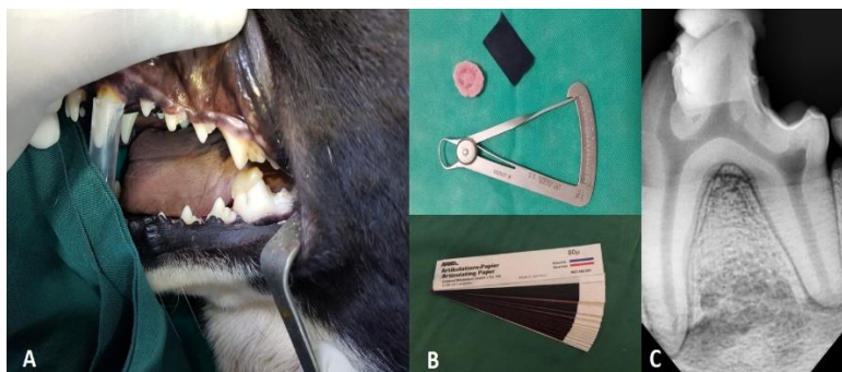
تصویر ۱: نمای کلینیکی و رادیوگرافیک ایجاد ترومای اکلوزن بر دندان مولر پایین سگ توسط اندکس اکریلی و کامپوزیت که افزایش ارتفاع اکلوزال توسط نوار آرتیکولاسیون و گیج مدرج تایید شده است.

مروری بر مطالعات نشان می‌دهد که تحقیقات انجام شده بر روی تاثیر ترومای اکلوزن بر راکسیون پالپ، پری اپیکال و PDL دندان‌های سگ، بسیار محدود می‌باشد. (۸-۱۱) Zhou و همکاران (۵) و Lindhe و Ericsson (۹) در مطالعات خود نتیجه گرفتند که ترومای اکلوزالی به تنهایی نمی‌تواند در پریدنتال لیگامنت ایجاد تخریب کند و حتماً باید التهاب و پریدنتیت همراه آن وجود داشته باشد، اما در این زمینه، طبق مطالعه Rodriguez و