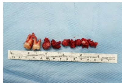
تصویر ۳: تومور استخوانی به همراه دندان‌های خارج شده درگیر

مطالعه Gordon و همکاران (۱۲) نشان دهنده شیوع ۵۹ درصدی استئوبلاستوما در مردان و ۴۱ درصدی در زنان می‌باشد. همچنین مندیل بیشتر از ماگزیلا درگیر این